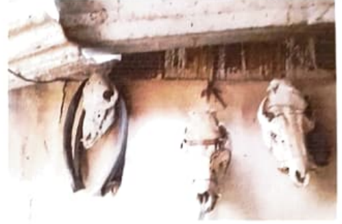
আলোকচিত্ৰ ৫ : আওলিং উৎসৱত যুৱতী সকলৰ অংশগ্ৰহণ আলোকচিত্ৰ ৬ : উৎসৱত ব্যবহৃত চিকাৰৰ মূৰ

যুৱসংঘ : নগা গাঁওখনত যুৱসংঘ আছে আৰু সংঘই মাজে-সময়ে গাঁৱৰ পৰিবেশ নিকাকৰণ, গছপুলি ৰোপণ আদি পৰিবেশ সচেতন সম্পৰ্কীয় কাৰ্য্যাবলী সম্পাদন কৰে।