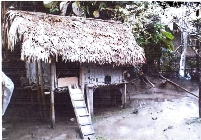
আলোকচিত্ৰ ৮ : কন্যাক নগা যুৱতীৰ হাঁহ-কুকুৰা পালন

বৰ্তমানৰ যুগ হৈছে বিজ্ঞানৰ যুগ। বিজ্ঞান আৰু প্ৰযুক্তি বিদ্যাৰ দ্ৰুত উন্নয়নৰ এই সময়ছোৱাত বিশ্বৰ উন্নত দেশবোৰৰ লগতে উন্নয়নশীল দেশসমূহে অৰ্থনৈতিক ক্ষেত্ৰখনত পূৰ্বৰ তুলনাত যথেষ্ট পৰিমাণে আগবাঢ়ি গৈছে। সেয়েহে এই সময়ছোৱাত যুৱপ্ৰজন্ম অৰ্থনৈতিকভাৱে স্বাৱলম্বী হোৱাটো অতি প্ৰয়োজনীয়। নগাসমাজৰ যুৱ প্ৰজন্মও বৰ্তমান কিছু পৰিমাণে সবল হোৱা পৰিলক্ষিত হয়।