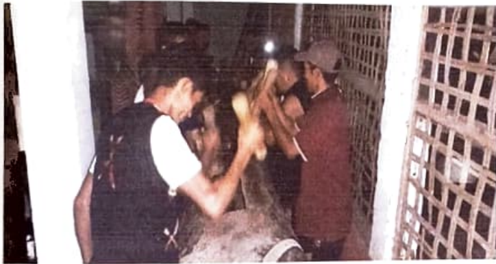
চিত্ৰ ২ : নগা যুৱকসকলে টুংখুং বজাই থকা চিত্ৰ

বাদ্যযন্ত্ৰ আৰু নৃত্য : তেওঁলোকে মৰংঘৰত 'টুংখুং' (কাঠেৰে নিৰ্মিত নাও আকৃতি) নামৰ বাদ্যযন্ত্ৰ ৰাখে আৰু প্ৰয়োজনৰ সময়ত বিশেষকৈ উৎসৱত আৰু কোনো পুৰুষৰ মৃত্যু হ'লে বজায়। কন্যাক নগাসকলে পা (যাঠি), চ্যাংম (দা) আৰু কান্ধত ৰাইচঙ (হোৰা) লৈ নৃত্য কৰে। মহিলাসকলে 'ঐয়া চাইপ' নৃত্য কৰে।