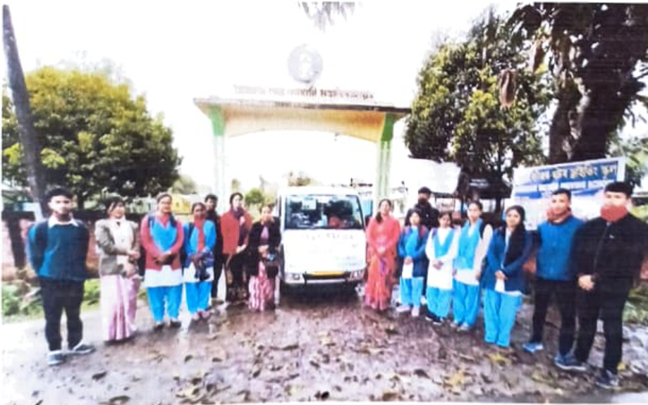
চিত্ৰ ১ : প্ৰকল্পৰ অধ্যয়নৰ উদ্দেশ্যে যাত্ৰাৰ সময়ত মহাবিদ্যালয়ৰ সন্মুখত শিক্ষাতত্ত্ব বিভাগৰ শিক্ষকৰ সৈতে যষ্ঠ যান্মাসিকৰ ছাত্ৰ-ছাত্ৰীসকল

উক্ত অধ্যয়নৰ কাৰণে প্ৰণালীবদ্ধ পদ্ধতি অৱলম্বন কৰি তথ্য আহৰণ কৰা হৈছে।