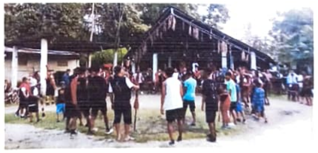
আলোকচিত্ৰ ৪ : মৰংঘৰৰ সন্মুখত যুৱকসকলৰ অংশগ্ৰহণ

মৰংঘৰ নিৰ্মাণ : গাঁওখনৰ ব্যক্তিসকল হিন্দী ধৰ্মাৱলম্বী। ধৰ্মীয় স্থান হিচাপে গাঁওখনত এটা মৰংঘৰ আছে। গাঁৱৰ যুৱকসকলে মৰংঘৰ নিৰ্মাণ কাৰ্যত আৰু মৰংঘৰৰ বিভিন্ন ধৰ্মীয় কাৰ্যসূচীত অংশগ্ৰহণ কৰে।