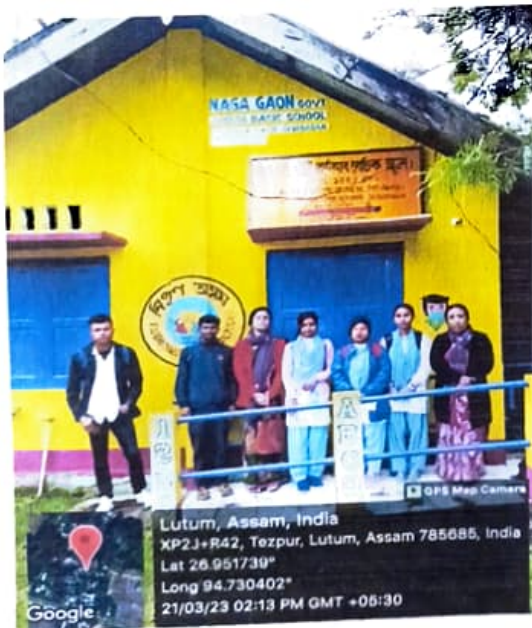
চিত্ৰ ৯ : নগা গাঁও চৰকাৰী কনিষ্ঠ বুনিয়াদী বিদ্যালয় সম্মুখত বিভাগীয় শিক্ষকৰ সৈতে প্ৰকল্প প্ৰস্তুত কৰোঁতাসকল

বৰ্তমানে নগা গাঁওৰ আশে-পাশে কেইবাখনো ৰাজ্যিক আৰু কেন্দ্ৰীয় ইংৰাজী মাধ্যমৰ বিদ্যালয় গঢ়ি উঠাত নৱপ্ৰজন্মৰ শিশু আৰু যুৱসকলে ইংৰাজী মাধ্যমত শিক্ষাগ্ৰহণ কৰিছে।