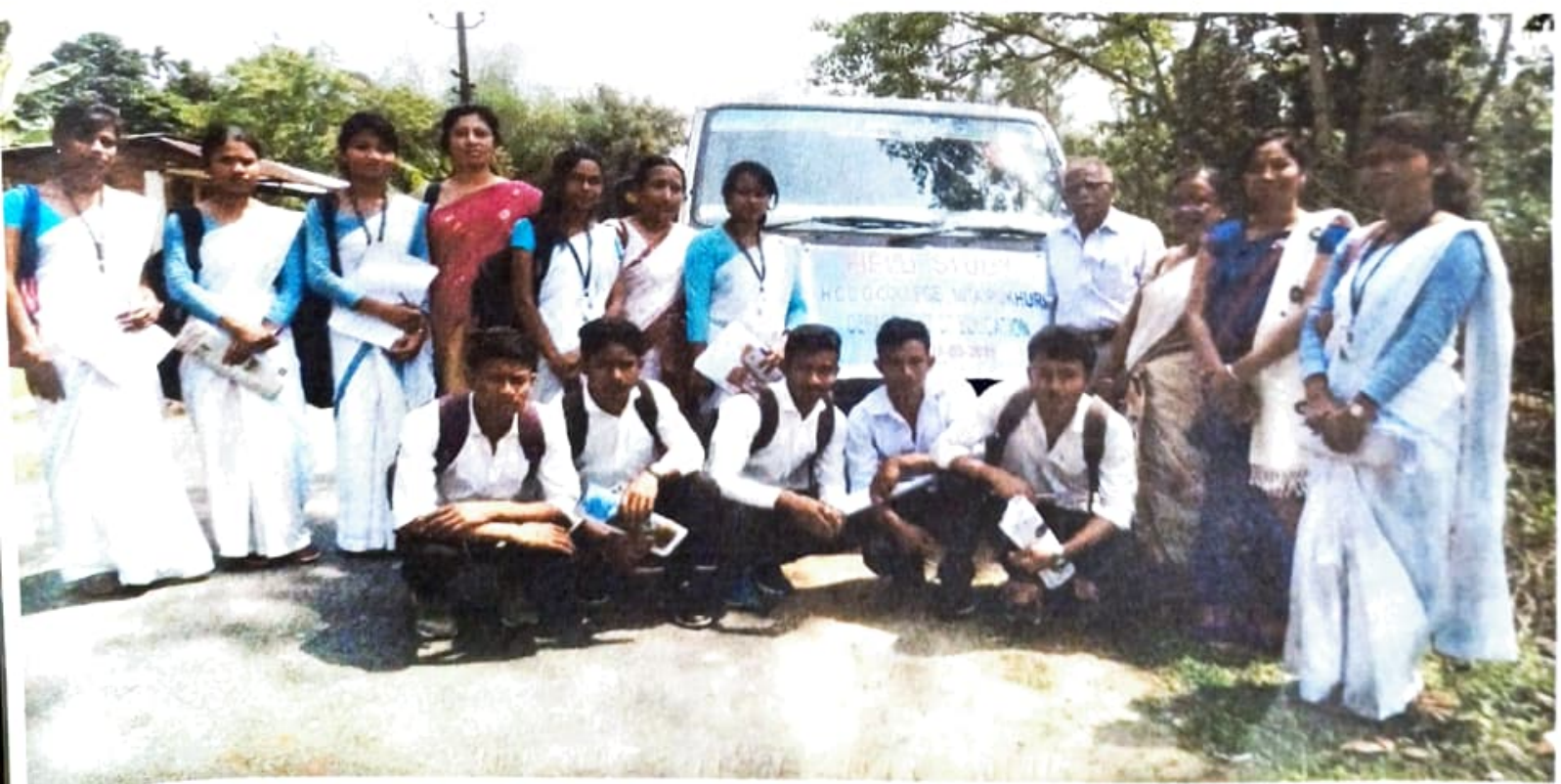
চিত্র ২: মেম্বারভিত্তিক অর্থগণনর বাবে চোরা এক দৃশ্য