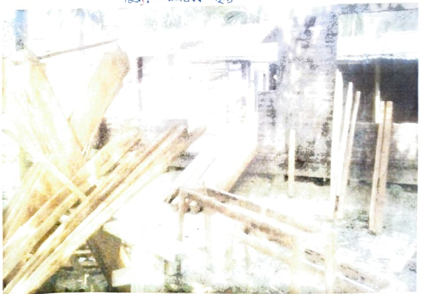
ছিত্তিঃ - কাঠৰ কুৰআলৰ ছিত্তি