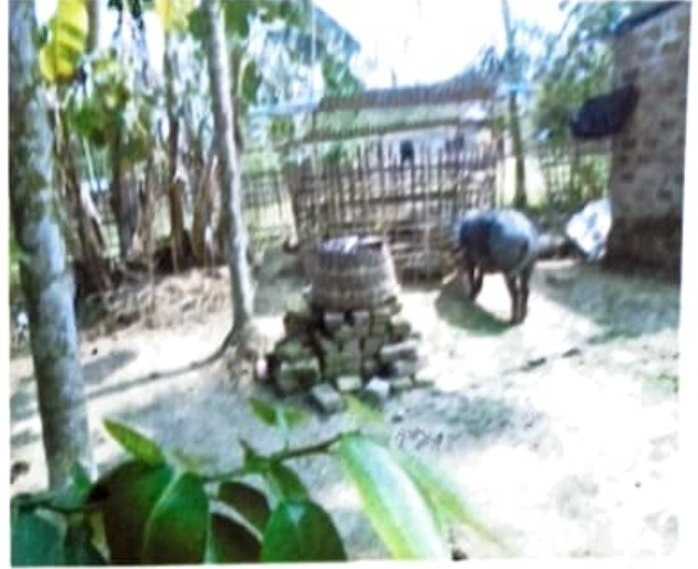
চিত্র ২ :- গাহৰি পালনৰ দৃশ্য