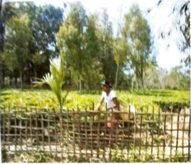
চিত্র ১ :- চাহ বাগানৰ দৃশ্য