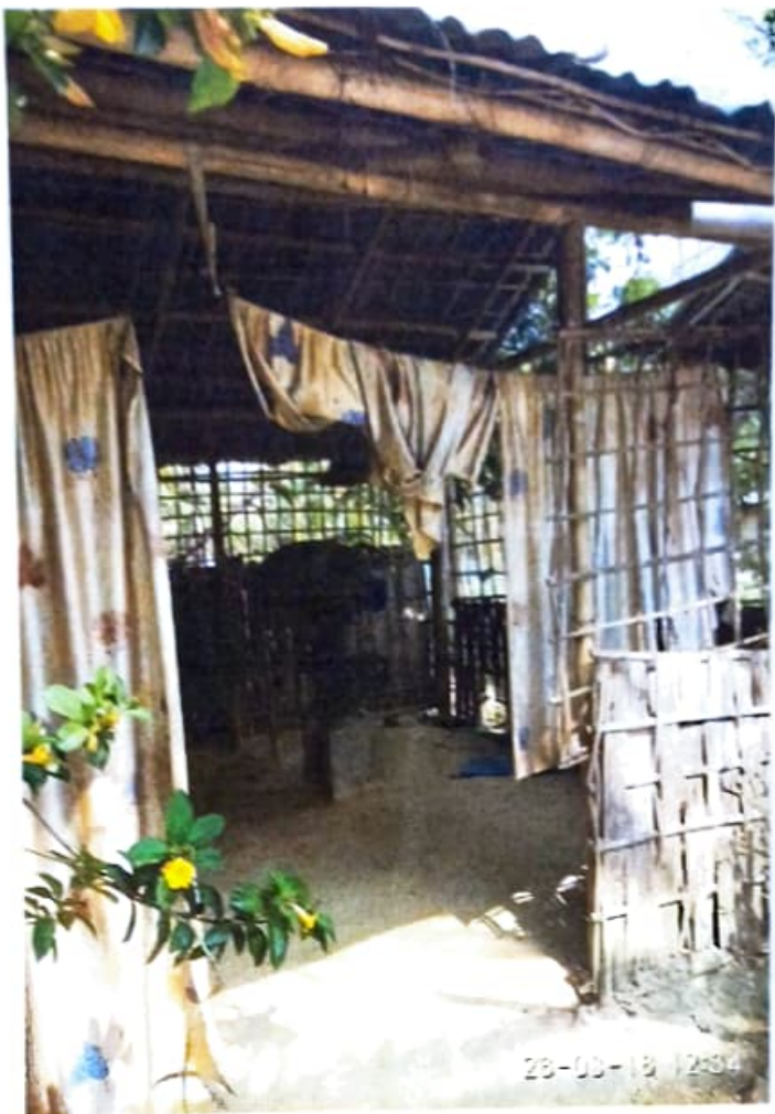
ছিত্তিঃ - কলচাকৰ হাট