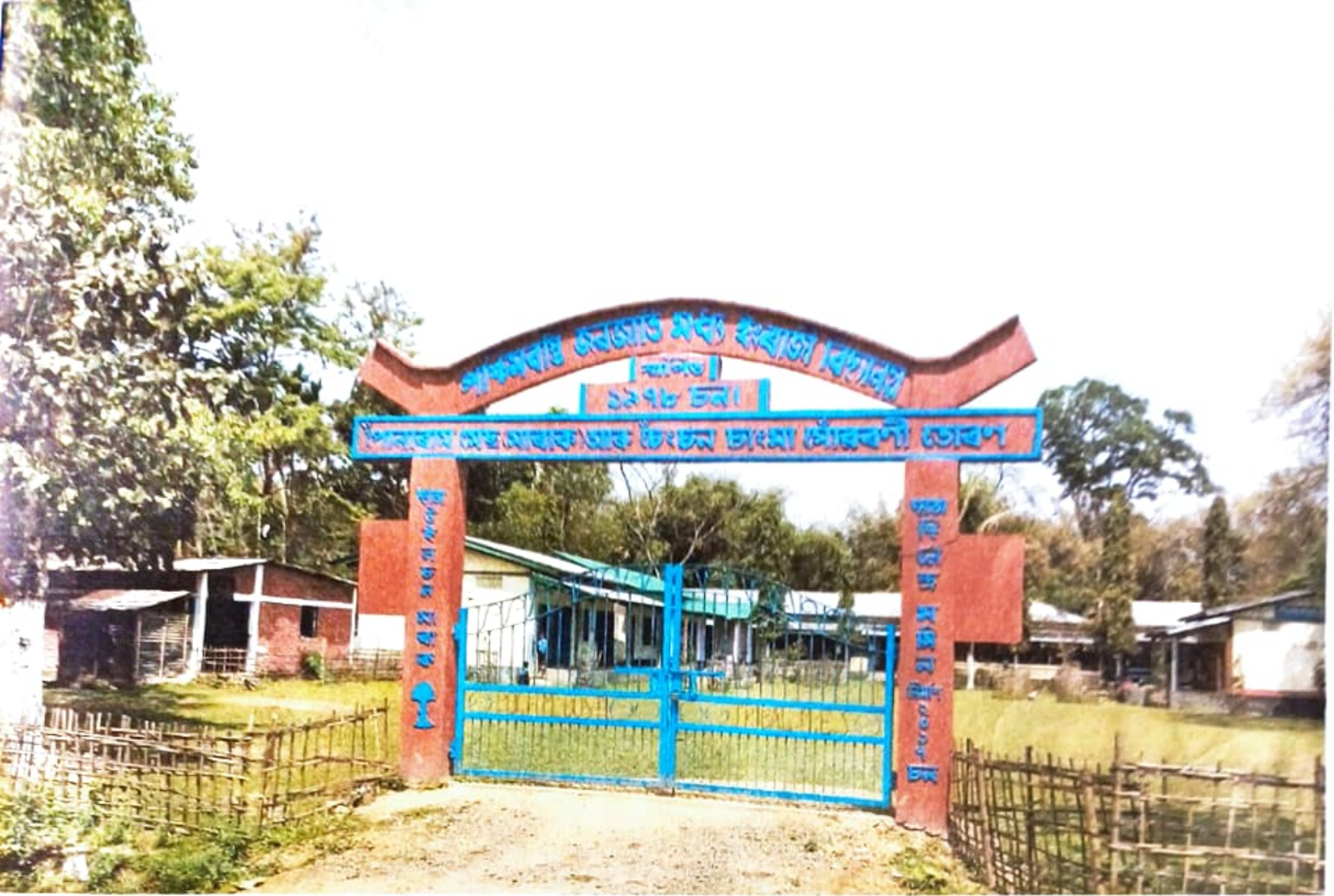
চিত্র ১: শিক্ষাব্যয় উন্নয়ন মঞ্চ কক্সবাজার বিশ্ববিদ্যালয়