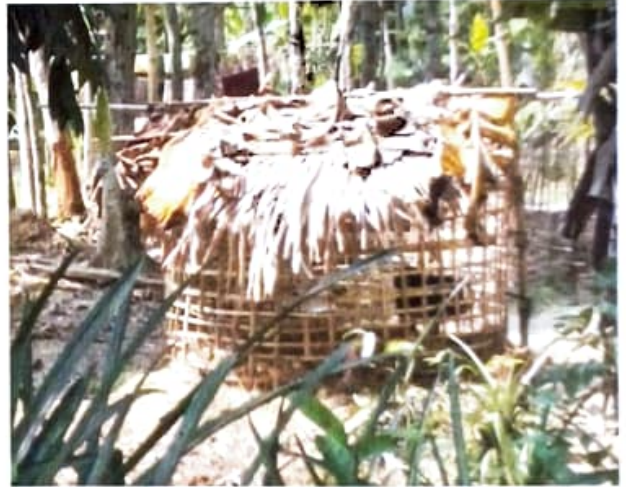
চিত্র ৪ :- বহুৰা আৰু গাহৰি পালনৰ দৃশ্য