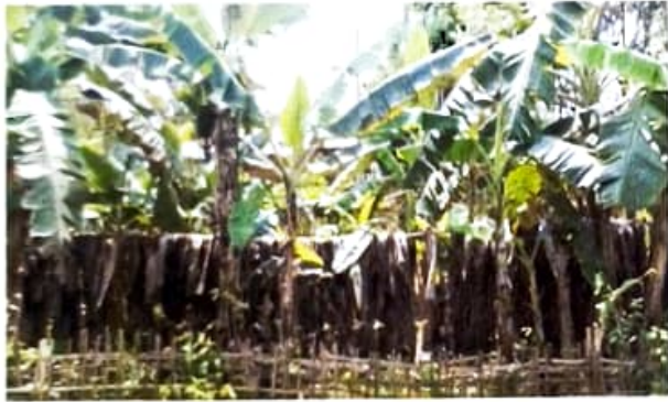
চিত্র ৩ :- কলবাৰীৰ দৃশ্য