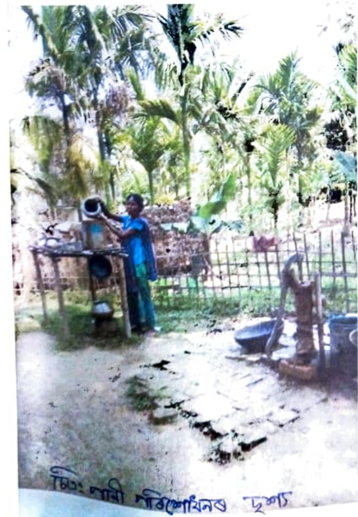
ଘର: ଧାନୀ ନିର୍ଦ୍ଦେଶନର ଦୁଆ