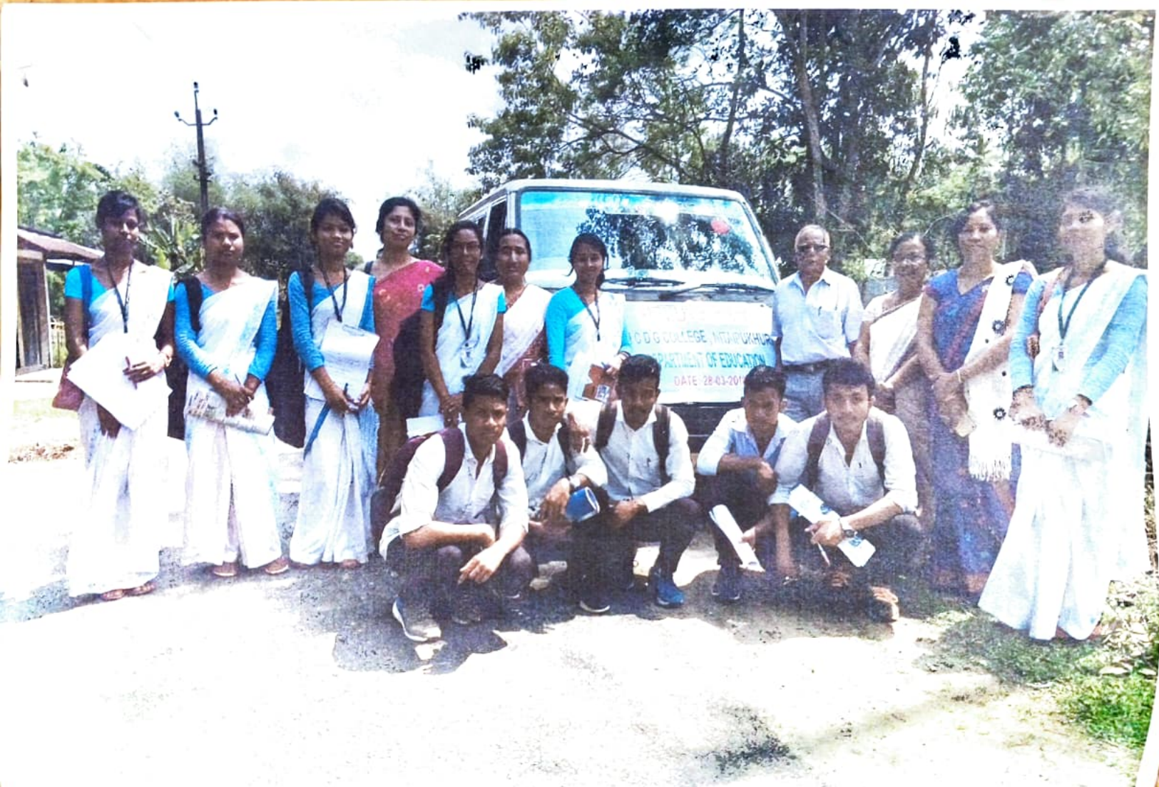
চিত্র: স্কলারশিপ অফিসের মাধ্যমে সফলভাবে স্নাতকোত্তর স্নাতকোত্তর পরীক্ষার প্রস্তুতি গ্রহণ করা হয়েছে।