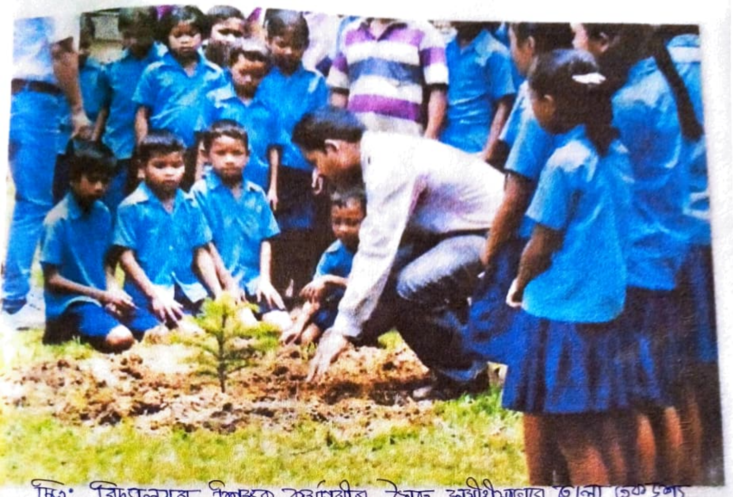
চিত্র: বিদ্যালয়ৰ শিক্ষক, কৰ্মচাৰীৰ সৈতে অগ্নীশীয়াতাবে তালনা ত্ৰুহুশ্য