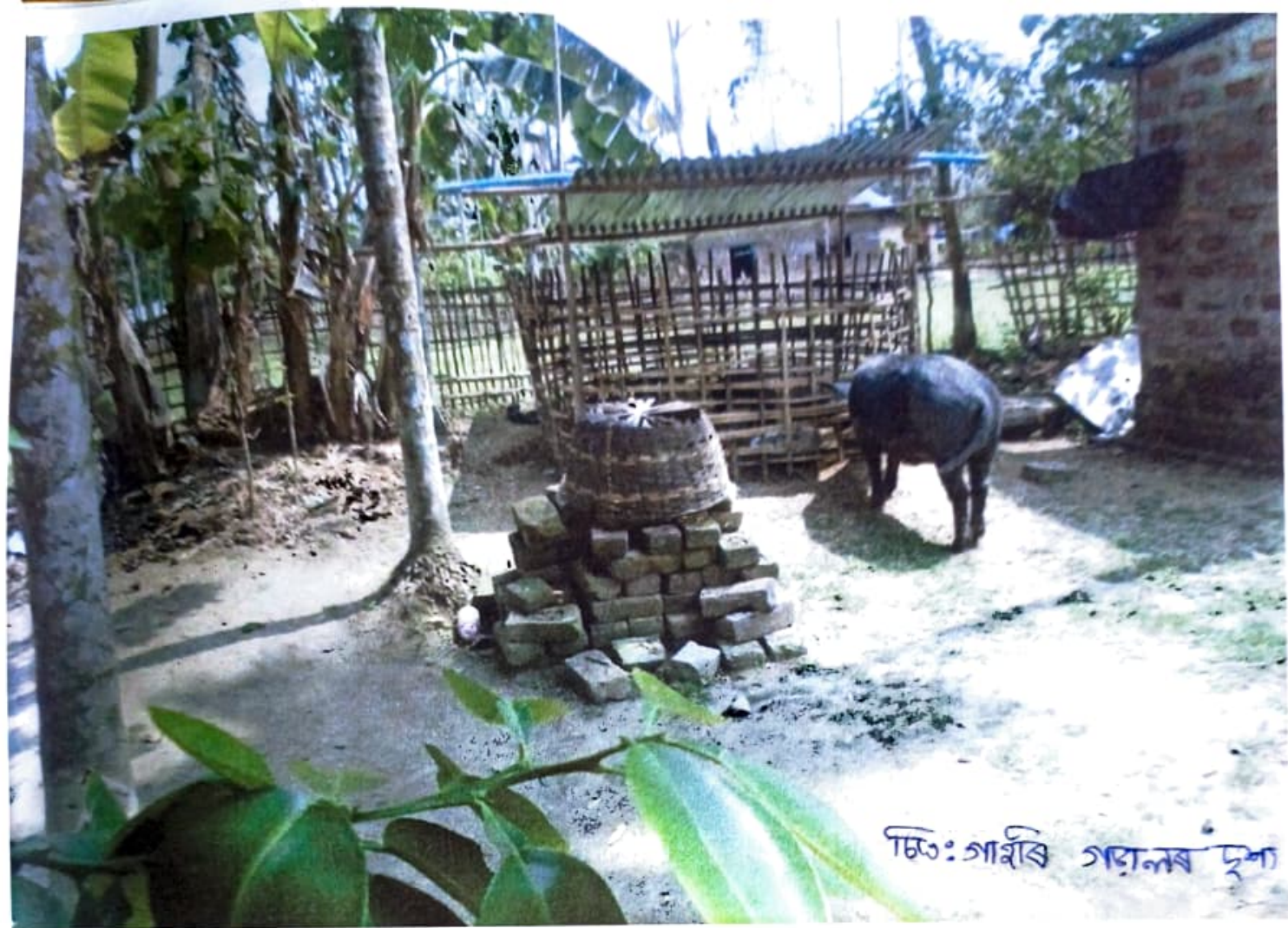
ଘର: ଗାଈର ଗଢ଼ାଣର ଦୁଆ