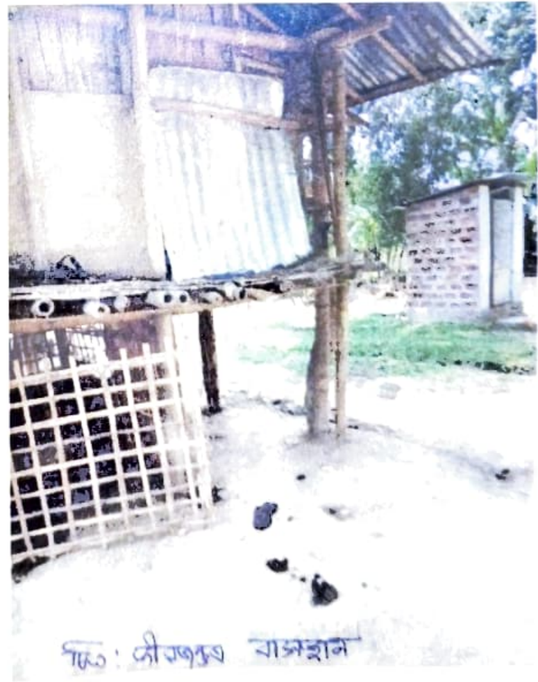
ଘର: ନୌକର ବାଜହାନ