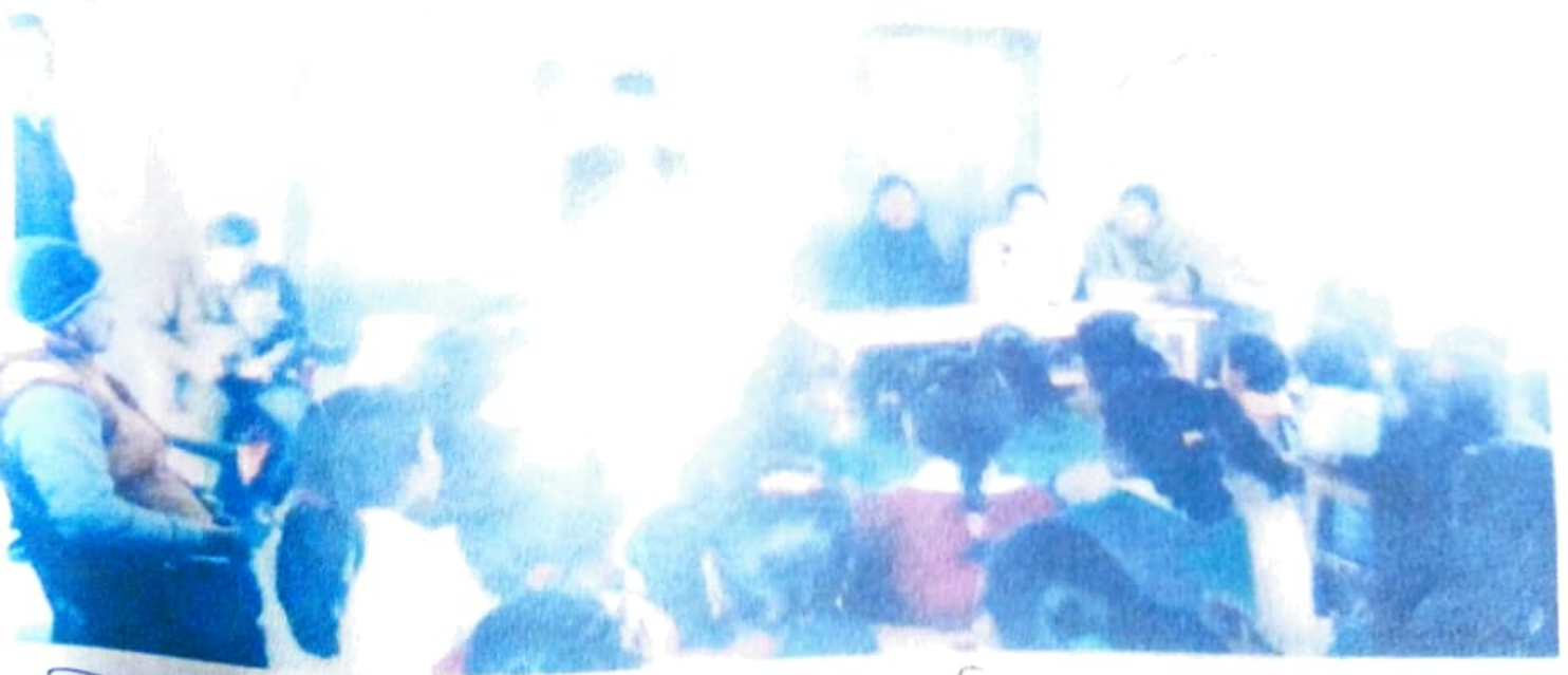
চিত্র: বিদ্যালয়ৰ ভাৰব সোম্বৰ অম্বুৱ নীদী, ঠাইত ৰখা হুশ্য